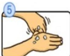
親指と手のひらをぬじり洗います。