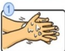
流水でよく手をぬらした後、石けんをつけ、手のひらをよくこすります。