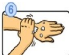
手背も忘れずに洗います。

石けんで洗い終わったら、十分に水で洗い、清潔なタオルやペーパータオルでよく拭き取って乾かします。