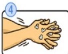
指の間を洗います。