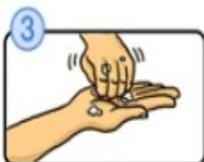
指先・爪の間を念入りこすります。