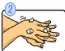
手の甲をのばすようにこすります。